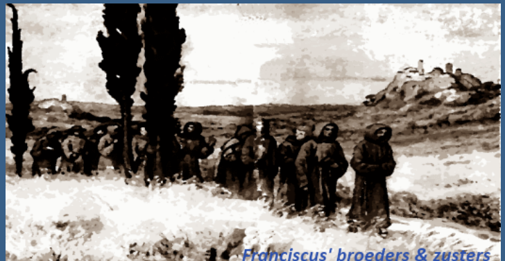
Franciscus' broeders & zusters

Eveneens op vrijdag om 11:15 uur bieden wij in dezelfde kerk de mogelijkheid om met elkaar het Evangelie te lezen. We lezen dan het Evangelie en staan er even bij stil. Dan delen we met elkaar in gesprek wat de tekst met je doet, waar het raakt of vragen oproept. Dit duurt een half uur. Aansluitend is er om 11:45 uur het middaggebed en om 12:00 uur het Angelusgebed. Om 12:05 uur sluiten we dan de kerk weer af. U bent hierbij natuurlijk van harte uitgenodigd!