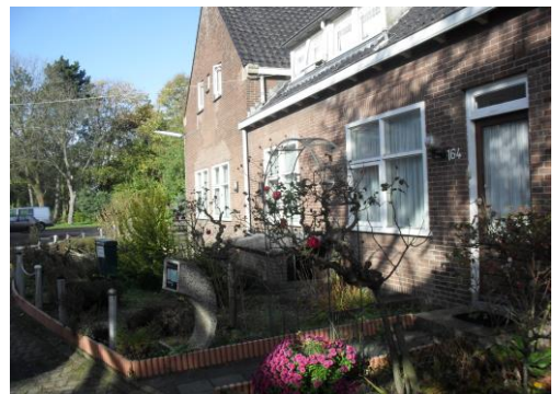
Ons huis waar we nu mogen wonen. Bredestraat 164, 6543 ZZ Nijmegen

Het is een mooie wijk met veel culturen waar wij met veel vreugde doorheen willen trekken. Gods schepping mogen aanschouwen op de vele manieren die Hij ons aanbiedt.