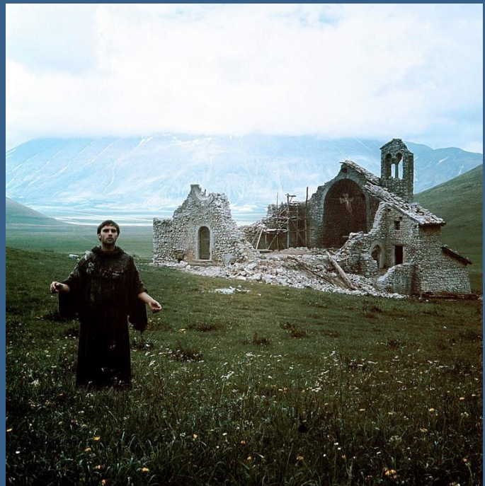
Franciscus die San Damiano herstelt.

Twee aan twee, niet drie aan drie, gezonden worden is niet allen voor ons een roeping, maar voor eenieder die zich geroepen voelt om het Woord te leven en uit te dragen in deze wereld. Niet morgen of overmorgen, maar NU!