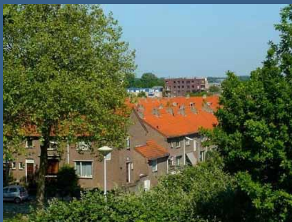
Een blik op een stukje wijk Nijmegen-West