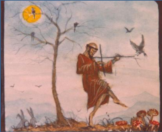
Aquarelle van Jan Vercammen